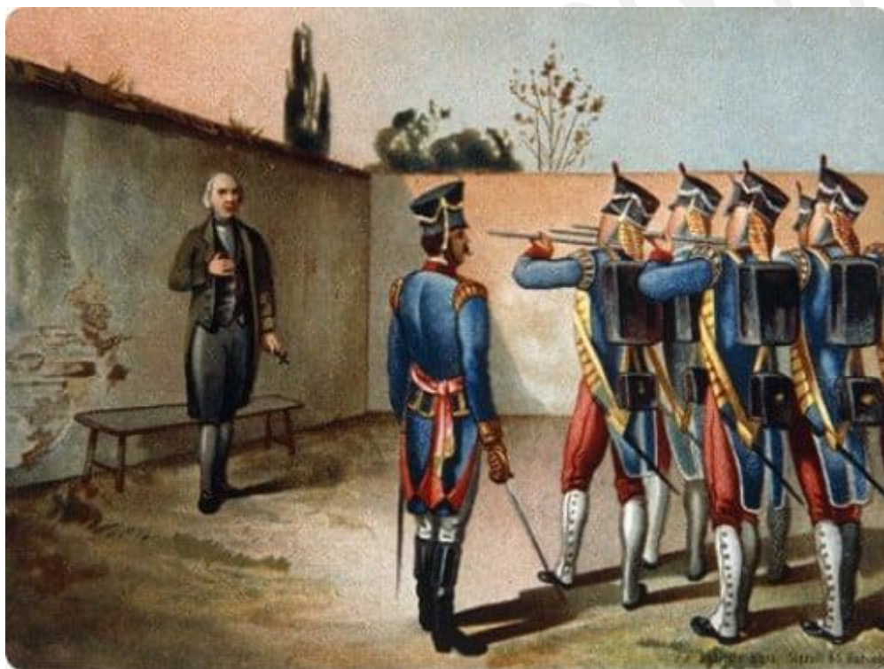
1811. Muere fusilado Miguel Hidalgo y Costilla, caudillo y héroe de la Independencia Nacional.