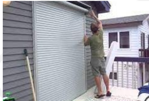
Imagen 3: Protección contra huracán

En consecuencia, de contar con un reglamento de construcción que sea más riguroso en cuanto a los anclajes de los materiales prefabricados y que los edificios de gran altura cuenten con protecciones contra huracanes en sus normas técnicas complementarias, permitirá que la Secretaría de Desarrollo Urbano y Obra Pública del municipio de Acapulco cuente con los elementos necesarios para denegar licencias de construcción a los proyectos ejecutivos que no contemplen los elementos de seguridad necesarios en anclajes de los materiales prefabricados en fachadas, muros interiores y plafones, teniendo los parámetros suficientes para las nuevas condiciones climáticas producidas por el calentamiento global lo que hará que las edificaciones sean más seguras.