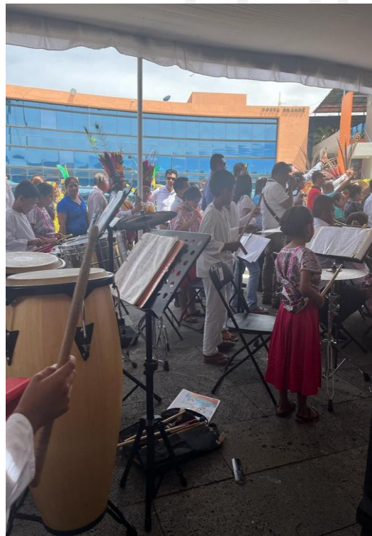
Banda Sinfónica Infantil de Tlacoachistlahuaca 2023.