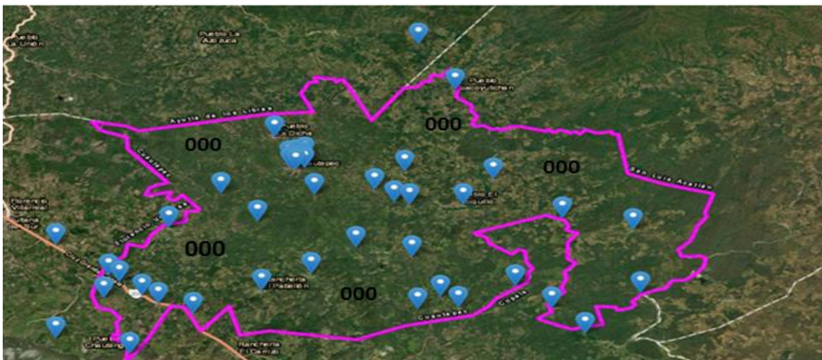
Sector Catastral 000.