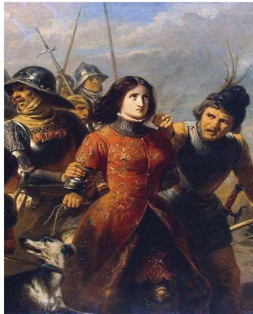
1412,- Nace Juana de Arco, heroína, militar y santa francesa.