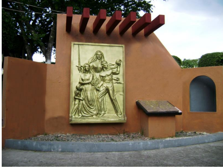
Monumento a los caídos en la alameda Francisco Granados Maldonado

1960.- Masacre en la alameda Granados Maldonado, ubicada en el Palacio Municipal de Chilpancingo.